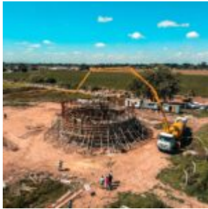
created by dji camera