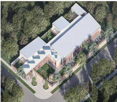
FOTO ARQUITECTÓNICA DEL NUEVO JARDÍN DE INFANTES 251 DE SAN GREGORIO