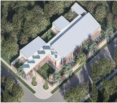
FOTO ARQUITECTÓNICA DEL NUEVO JARDÍN DE INFANTES 251 DE SAN GREGORIO