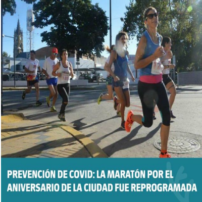
PREVENCIÓN DE COVID: LA MARATÓN POR EL ANIVERSARIO DE LA CIUDAD FUE REPROGRAMADA