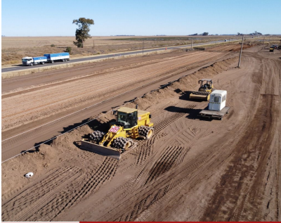
AUTOPISTA 33: ENRICO PLANTEÓ LA PREOCUPANTE SITUACIÓN QUE ATRAVIESA LA OBRA Y SU RIESGO A PARALIZARSE