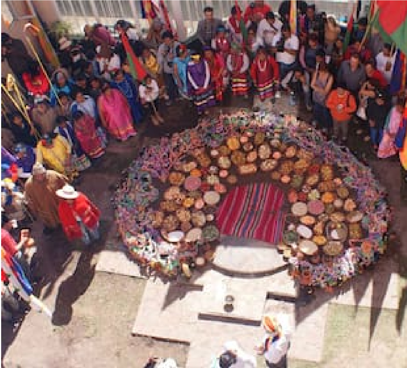
Las ofrendas también se pueden colocar sobre un altar